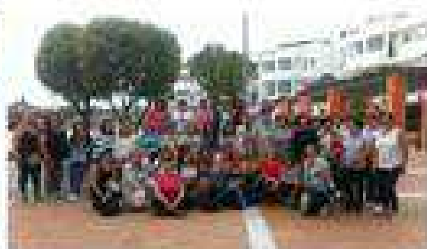
Miembros de la asociación en la Jornada provincial de Mujeres. (Sept)