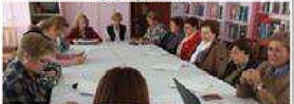
Algunas voluntarias en el Proyecto: "La asociación ayer, hoy y mañana"