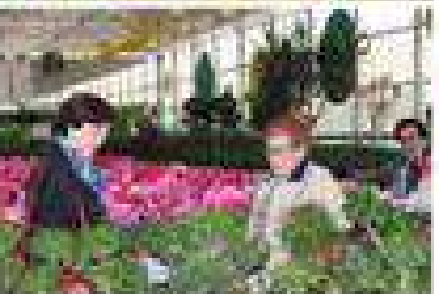
Visitamos un vivero.