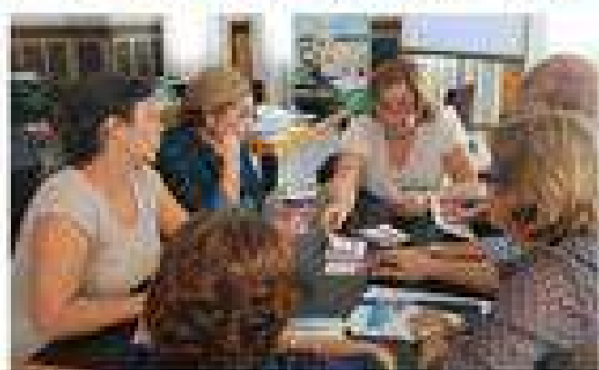
La Junta Directiva se reúne en Laujar para planificar el curso 2014-