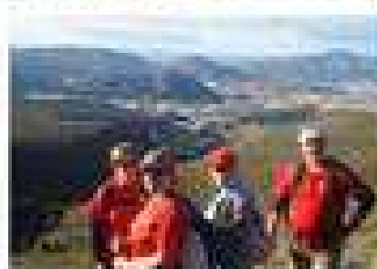
"Paseos por la naturaleza" en Castala y en noviembre