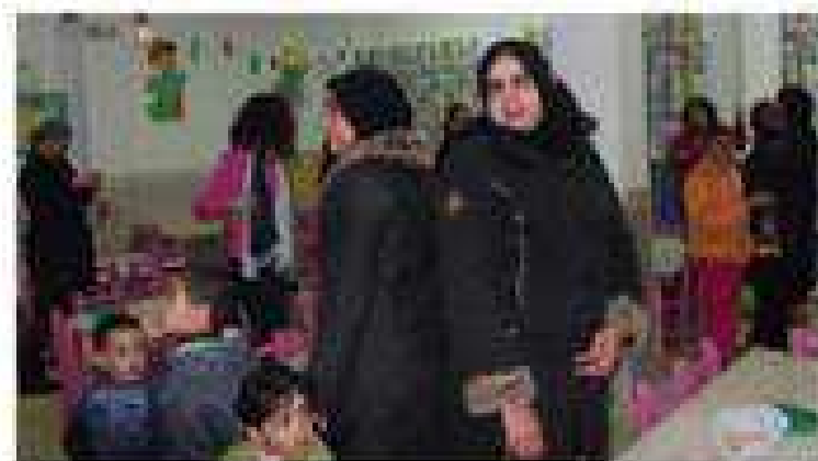
Padres decorando CEI BAMBI para la