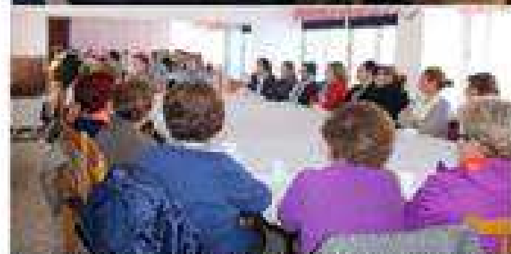
Charla sobre "Menopausia y mujeres"