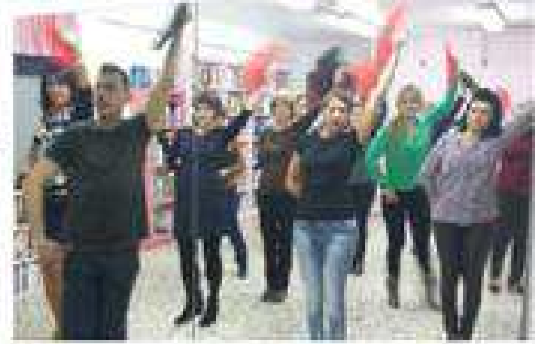
Nuestras clases de flamenco