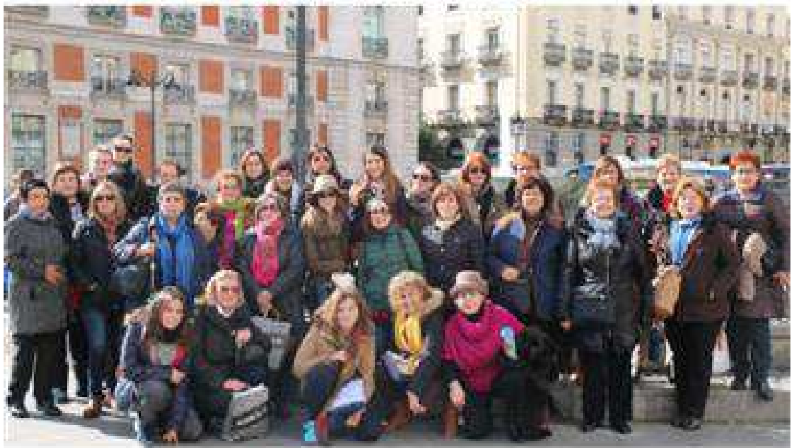
En Madrid para ver El Rey León

La asociación de mujeres "La Aldeilla" a sus 35 años, sigue