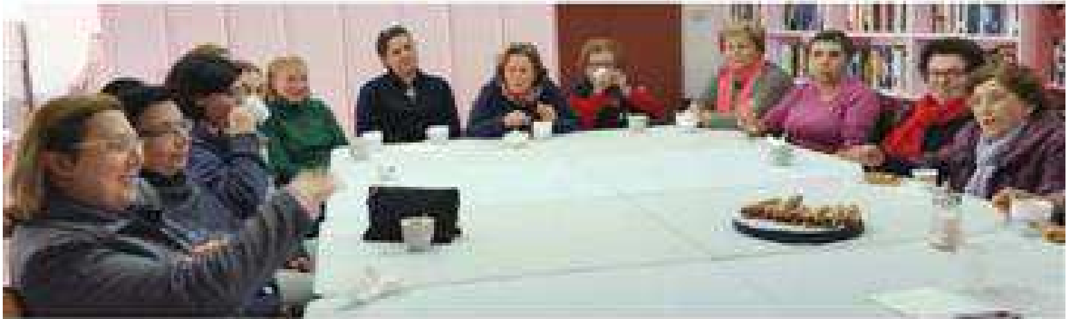
Cómo enfrentarnos a una depresión.