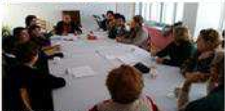
Todos los martes tenemos "TERTULIA LITERARIA".