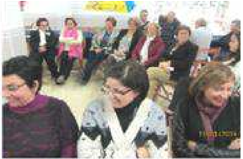
Comenzamos el año 2015